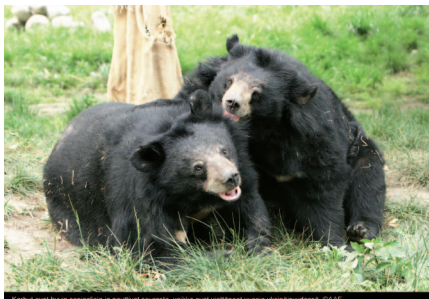
Karhut ovat hyvin sosiaalisia ja nauttivat seurasta, vaikka ovat viettäneet vuosia yksinäisyydessä.