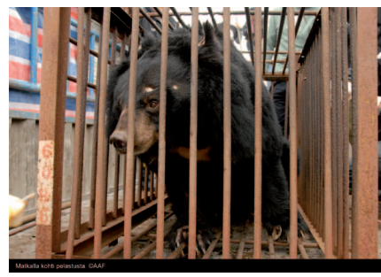
Matkalla kohti pelastusta.