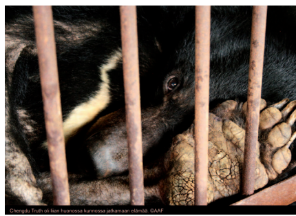
Chengdu Truth oli liian huonossa kunnossa jatkamaan elämää.