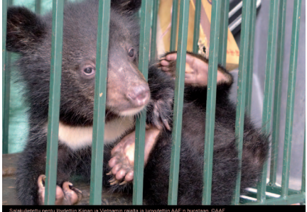
Salakuljetettu pentu löydettiin Kiinan ja Vietnamin rajalta ja luovutettiin AAF:n huostaan.