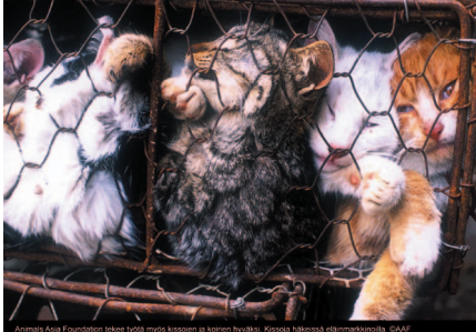
AAF tekee työtä myös kissojen ja koirien hyväksi. Kissoja häikeissä eläinmarkkinoilla.