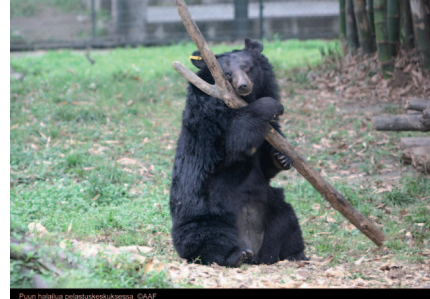
Puun halailua pelastuskeskuksessa.