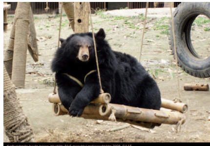
Karhuryhmän hyvän toivon lähettiläs Mafi menehtyi maksasyöpään 2008.