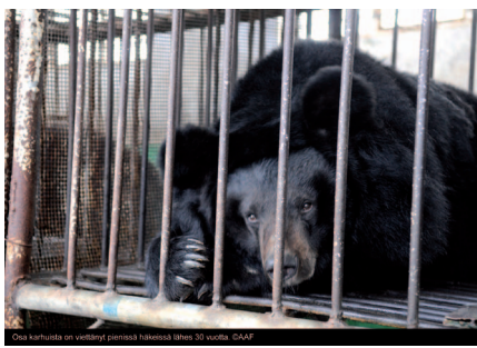
Osa karhuista on viettänyt pienissä häikeissä lähes 30 vuotta.