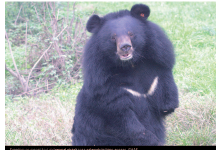
Freedom on menettänyt molemmat etujalkansa salametsästäjien ansaan.