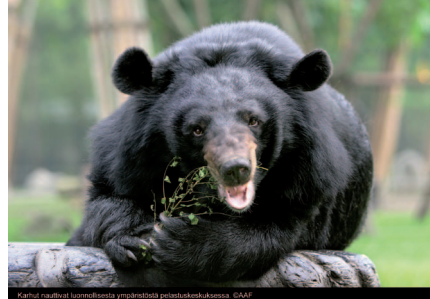
Karhut nauttivat luonnollisesta ympäristöstä pelastuskeskuksessa.