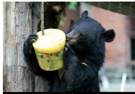
Pelastuskeskuksessa kuumia päiviä helpotetaan mehujällä.