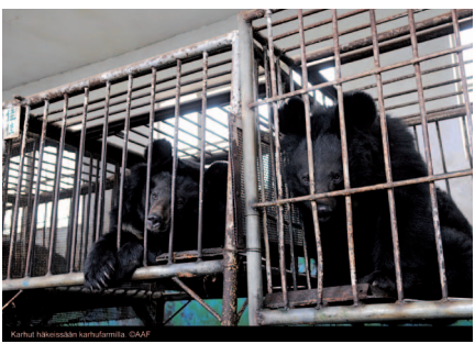
Karhut häikeissään karhufarmilla.